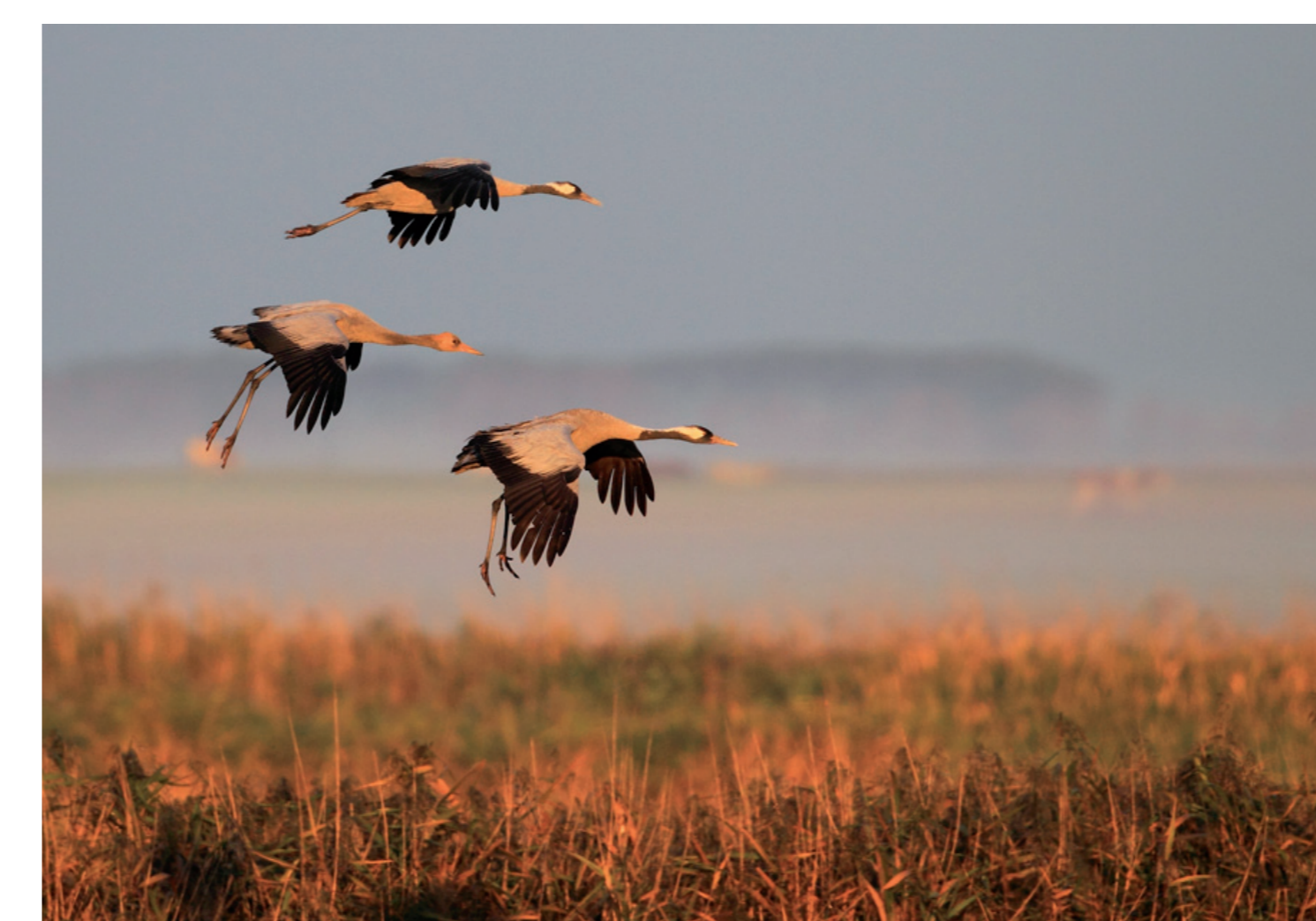
Kraniche über der Horloffau

Zur Zeit des Vogelzugs ist die Artenvielfalt im Gebiet besonders groß. Dann kommen zahlreiche Enten und Watvögel aus Nord- und Osteuropa und Sibirien zur Nahrungssuche und Rast. Darunter sind Tafelente , Pfeif- , Krick- und Knäkente , Kampfläufer , Grün- und Rotschenkel . Zudem gesellen sich in den Wintermonaten arktische Saat- und Blässgänse zu den heimischen Graugänsen. Ein besonderes Erlebnis ist der Durchzug der Kraniche im Frühjahr und Herbst.