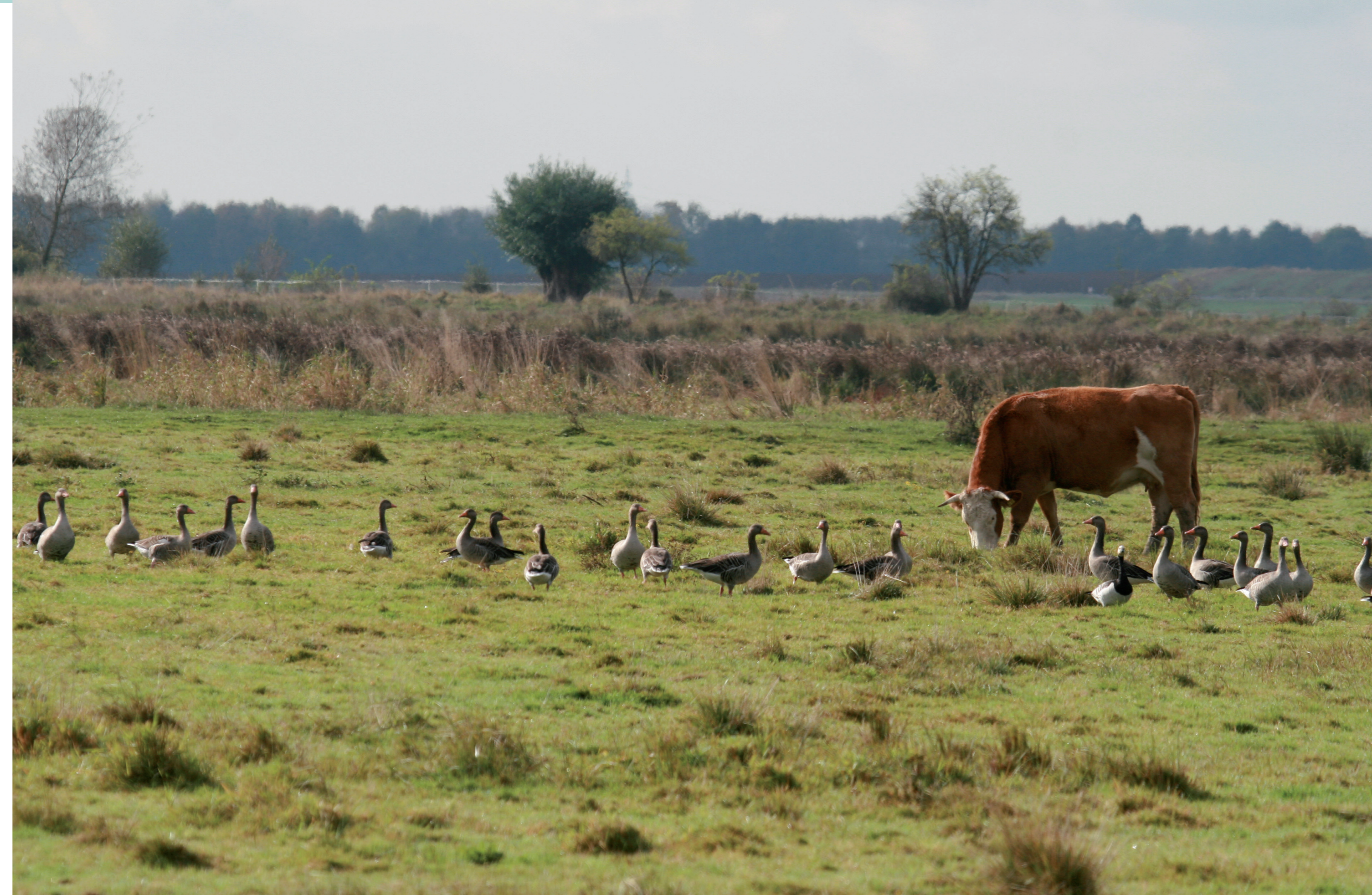
Scharen von Graugänsen inmitten weidender Rinder – ein typischer Anblick in der Mittleren Horloffau. Die extensive Beweidung dient dem Erhalt der Grünlandflächen und schafft Lebensraum für zahlreiche Arten.

Als europäisches NATURA 2000-Gebiet hat die „Mittlere Horloffau“ auch internationale Bedeutung. Sie gehört zum Kern des EU-Vogelschutzgebiets „Wetterau“ und trägt als Fauna-Flora-Habitat-Gebiet zum Erhalt bedeutender Arten und Lebensräume in Europa bei.